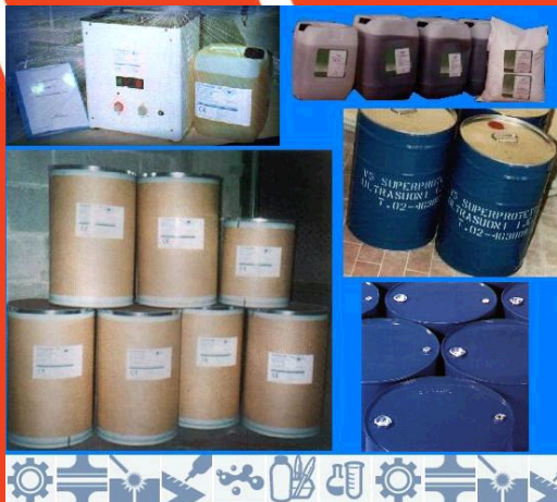
Questa è una nota da scrivere sotto l'immagine